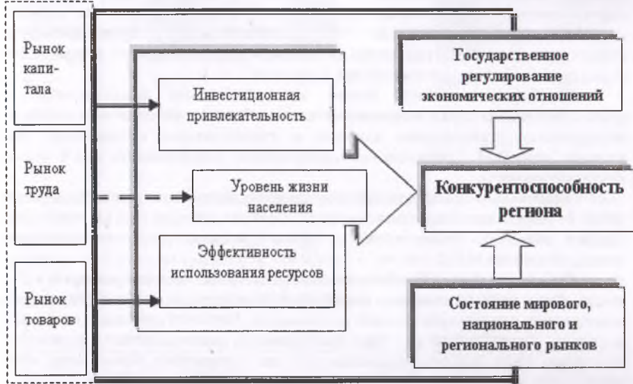
Рис. 1. Составляющие конкурентоспособности региона

3. Его инвестиционную привлекательность (конкурентоспособность финансов).