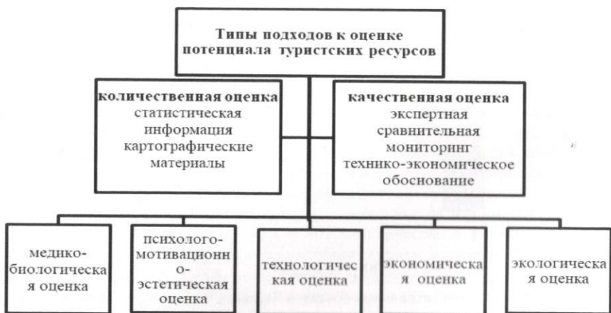
Рисунок 3. Основные подходы и методы оценки потенциала туристских ресурсов

Результаты анализа методических подходов позволяют предположить, что в целях проведения эффективной оценки потенциала сакрального туризма необходимо использование комплексного подхода, реализуемого путем оценки сакральных туристских объектов на основе покомпонентного анализа и оценки максимального количества элементов историко-культурного, природного и экономического потенциала и выявления зависимостей между отдельными группами ресурсов, влияющих на развитие туризма в целом.