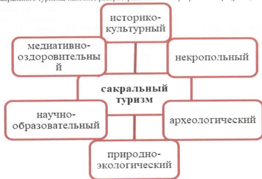
Рисунок 1. Классификация сакрального туризма

На основании проведенных исследований, выделено 6 разновидностей сакрального туризма, наиболее распространенных и популярных в мире (рис.1).